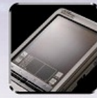
タッチパネル端末の アイコンシート・画面保護 Display protection for touch panel display