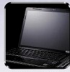
パソコン・カメラ等 画面保護 Display protection for PC, digital camera